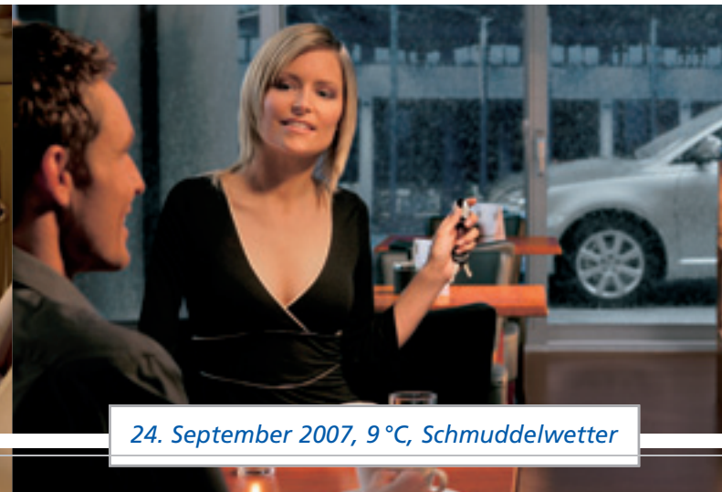
24. September 2007, 9 °C, Schmuttelwetter