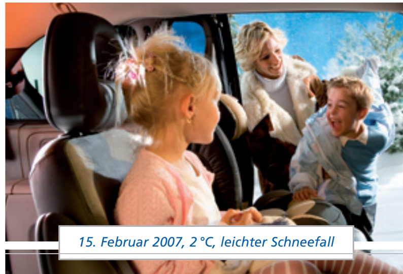
15. Februar 2007, 2 °C, leichter Schneefall