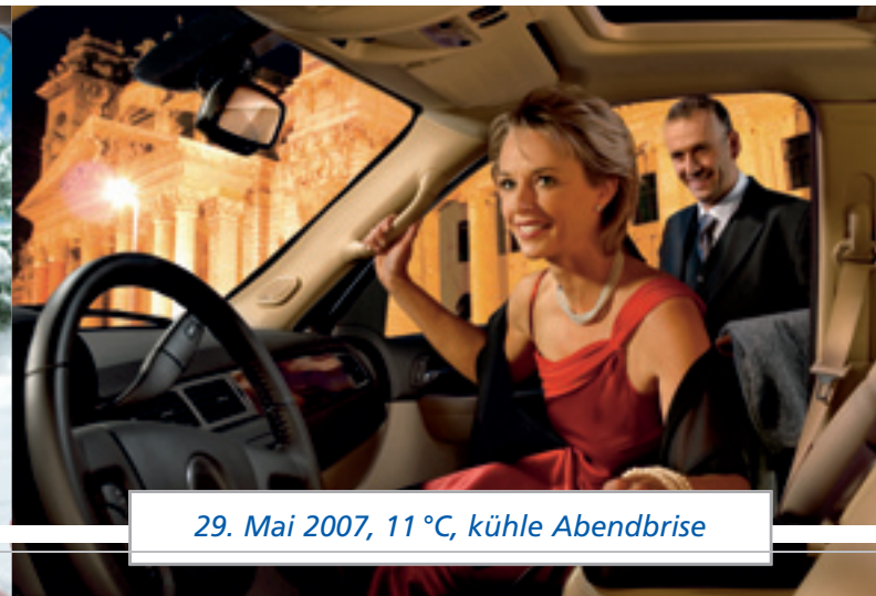
29. Mai 2007, 11 °C, kühle Abendbrise