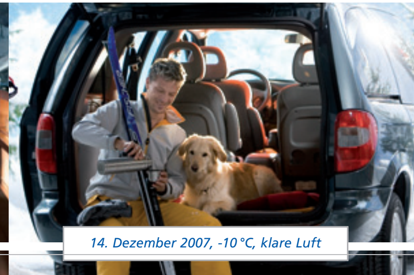
14. Dezember 2007, -10 °C, klare Luft

Nasskaltes Nieselwetter, düstere Nebeltage, eisiger Ostwind – in Deutschland gibt es vom frühen Herbst bis zum späten Frühling wenige schöne Tage. Und jede Menge Gründe für eine Webasto Standheizung. Schließlich kommen Sie auch nicht nach Hause und drehen erst dann die Heizung an. Mit Ihrem Auto ist es genauso. Steigen Sie einfach ein und fühlen Sie sich so wohl, wie in Ihrem Wohnzimmer. Aber das war noch nicht alles, denn eine Webasto Standheizung hat noch viel mehr Vorteile. Sind Sie bereit? Dann machen Sie sich schon mal warm.